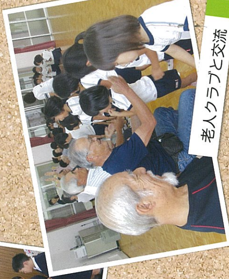
老人クラブと交流