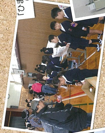
「ひまわりの家」通所者と (生活科の学習で)