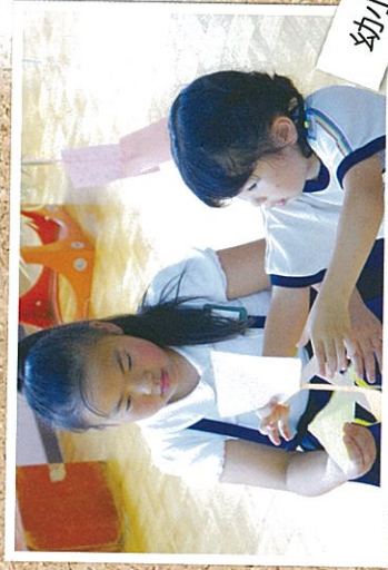
幼小交流・七夕祭