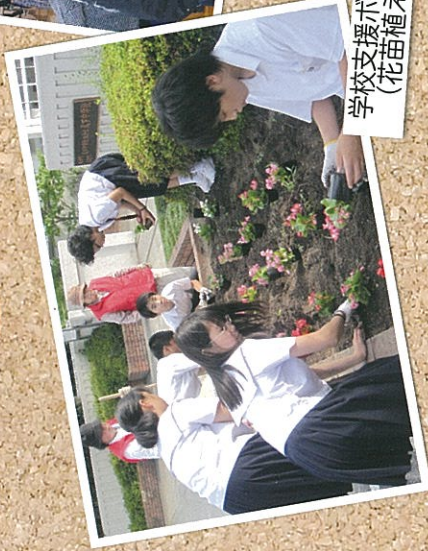
学校支援ボランティアと (花苗植え替え活動)