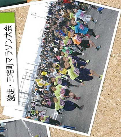
激走・三宅町マラソン大会