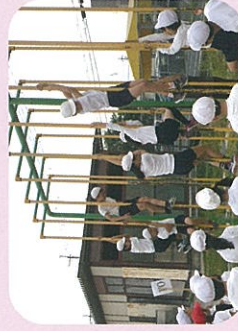
朝スポ (異年齢集団で体力づくり)