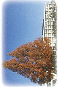
シンボルツリー「メタセコイヤ」