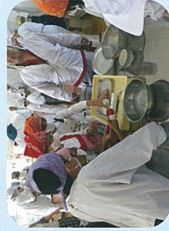
ひまわりの家通所者と