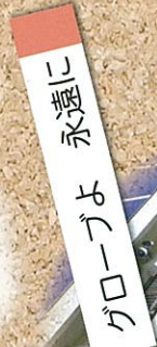
グローブよ 永遠に