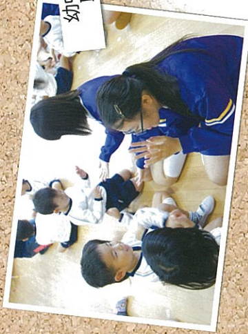
幼中交流・中学校 職場体験学習