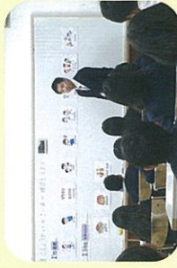
外国語学習 (E Room にて)