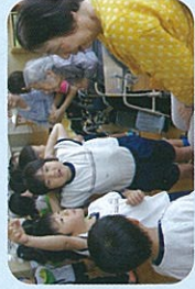
▲デイサービス訪問

【地域の方々】語り部の会・みやけまちづくりの会・石見文庫・サバの会・ひまわりの家・三宅消防団