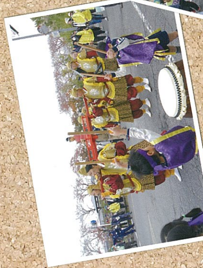
大活躍・太子道の集い