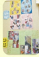
▲ドキュメンテーション

多様な環境にある保護者に、保育に関心を寄せてもらうため、クラスだよりやグループ保育日より、保育ドキュメンテーションなどで情報発信しています。また、保護者との懇親会を開催し、保育の様子や、保育で大切にしている事などをパワーポイントでプレゼンテーションを行っています。