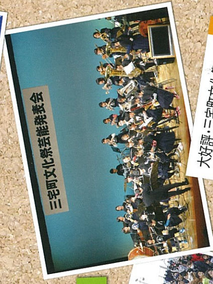
三宅町文化祭芸能発表会