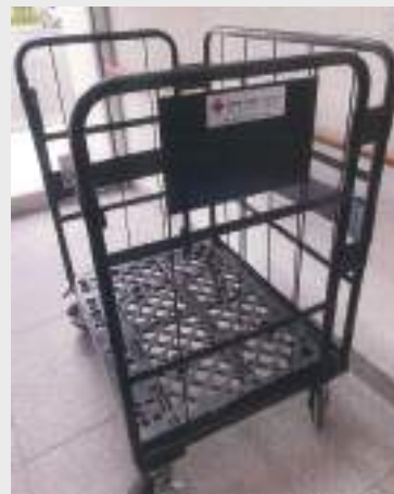
☎ 健康子ども課 ☎0745-43-3580

みなさまからの厚いご支援、ありがとうございます。今後とも、ご理解とご協力をお願いいたします。