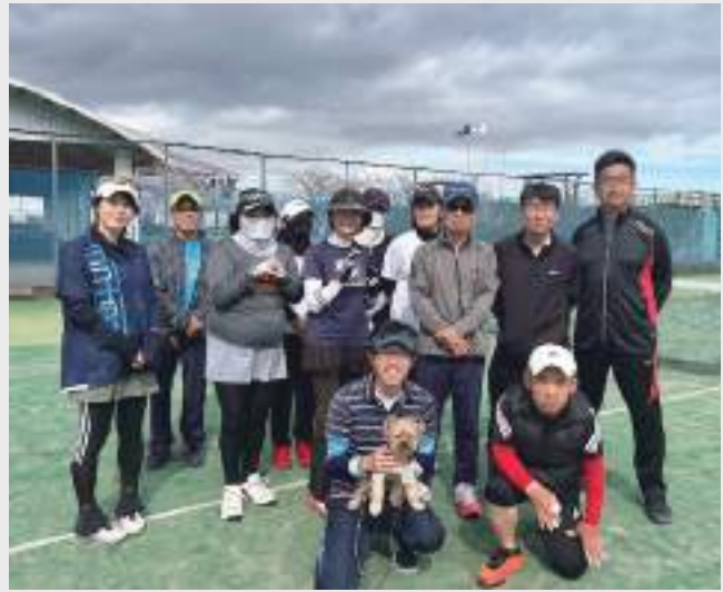
☎ 社会教育課 ☎0745-44-2210

惜しくも三宅町勢の優勝とはなりませんでしたが、随所に粘り強いプレーが光り、勝敗を超えて心地よい汗を流しながら交流を深める、実りある一日となりました。三宅町スポーツ協会では、これからもスポーツを通じた健康づくりと地域の絆づくりを推進してまいります。選手の皆様、ならびに運営に携わった皆様、本当にお疲れ様でした！