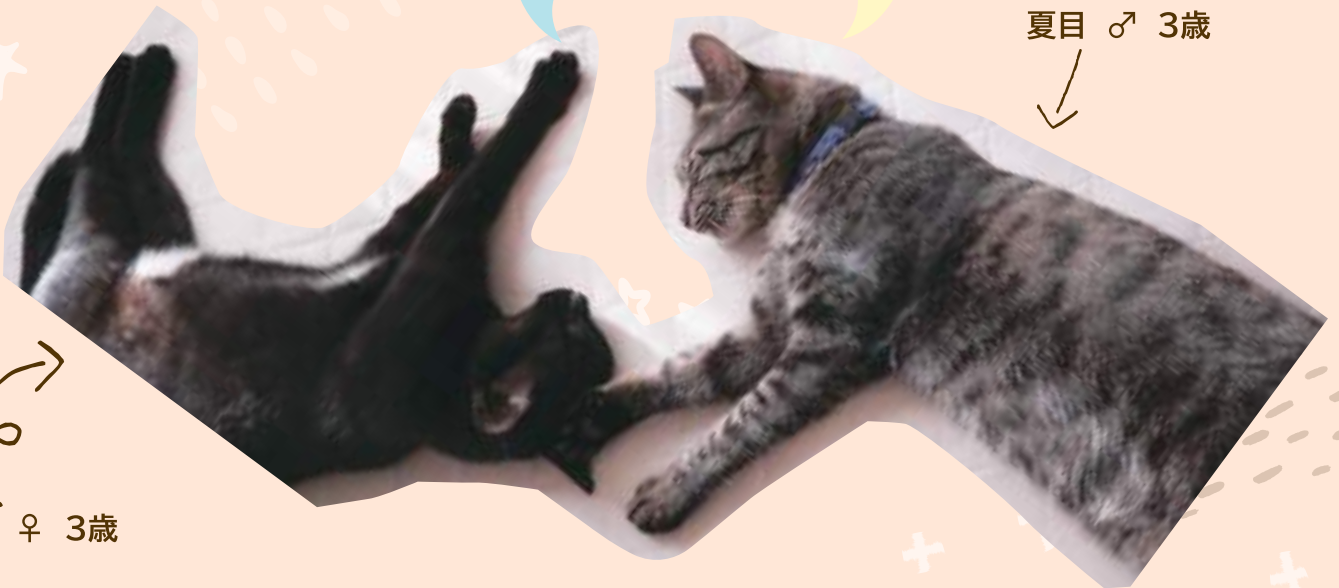
夏目 ♂ 3歳