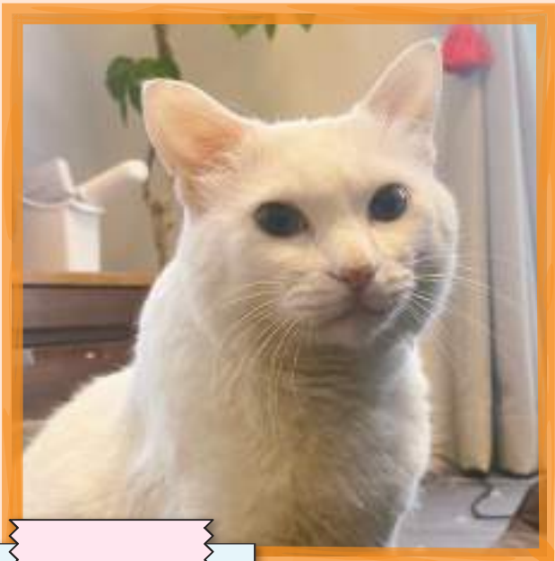
トントン 7歳 雑種 青い目が チャームポイント