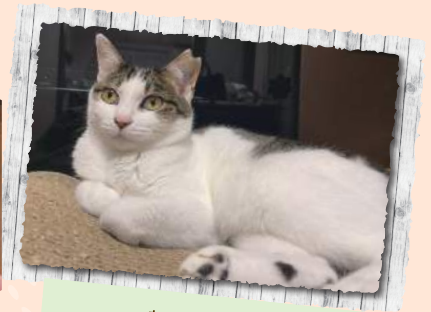
あてな ♀ 9歳 爪とぎベッドがお気に入りのいい子です