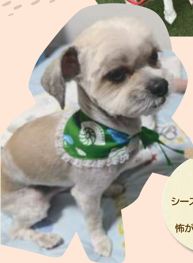
じんくん ♂ 6歳 シーズーとチワワの ミックス 怖がりで甘えん坊