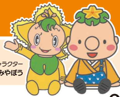
三宅町公式マスコットキャラクター みやびび・みやぼう